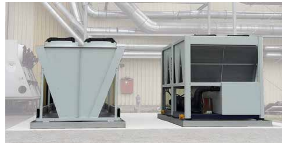
Kombination eines Kälteaggregates mit einem Rückkühler

**) Leistungsaufnahme Ersparnis in kW im Rückkühlerbetrieb